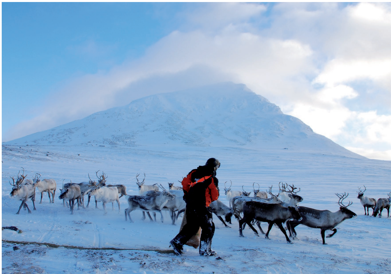
Foring av rein i Mauken.