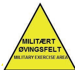
Skilt rundt sammenbindingskorridoren og tilsvarende øvingsområder.

I Sammenbindingskorridoren foregår det ikke skarpskyting, men det øves med løsammunisjon, markeringsmidler og kjøretøyer, både på og utenfor vei. Dette og tilsvarende områder er merket med "Militært øvingsfelt".