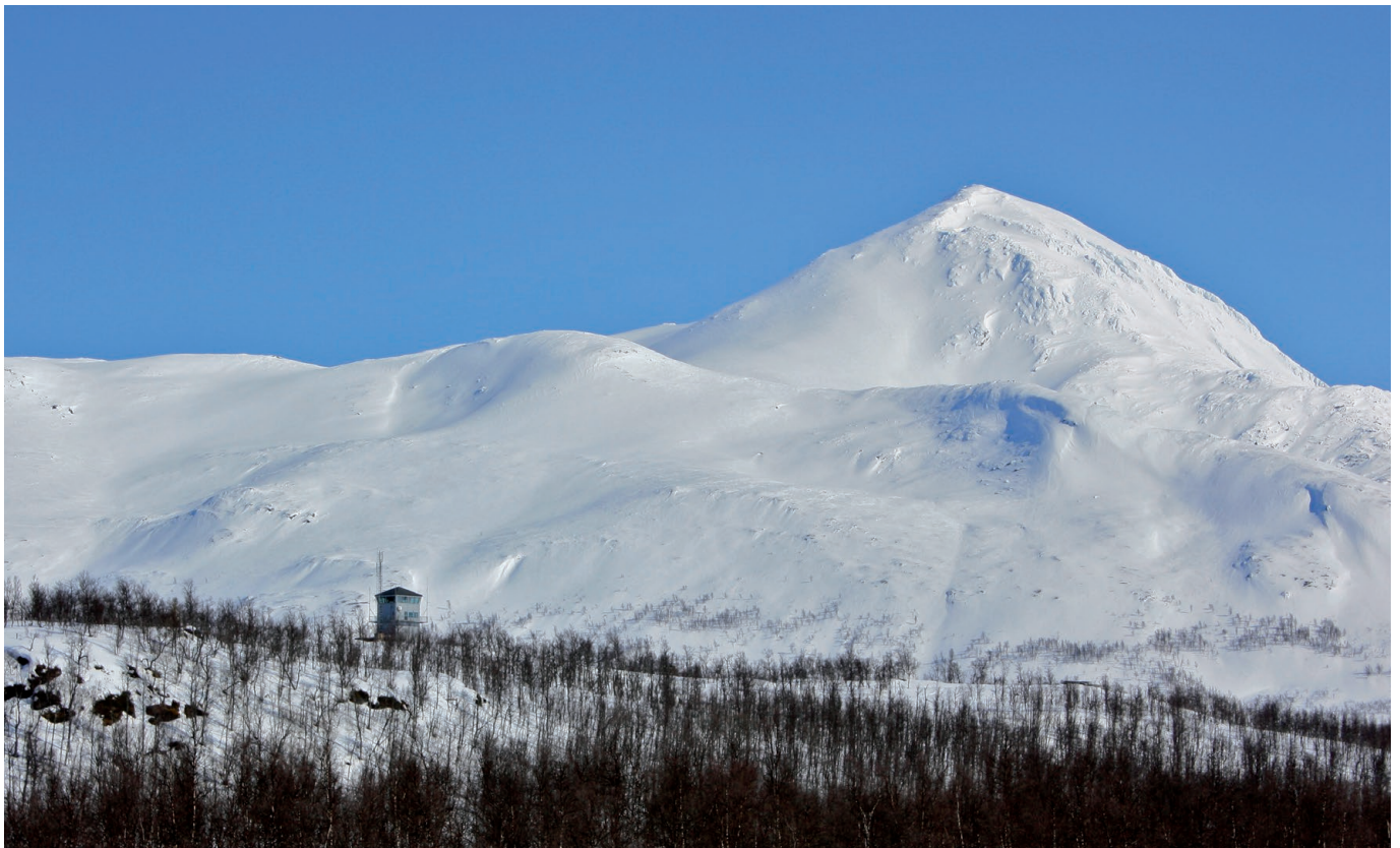
Blåtind med skyteledertårn.

Tyngden av anlegg for skarpskyting er i Blåtind konsentrert til de vestre og nordvestre deler, med basis i Akkaseter og Skardalen/Mårfellskaret. I dette området skytes det med alle typer håndvåpen og infanteriets tyngre støttevåpen samt feltartilleri, stridsvogner og stormpanservogner. Øst i feltet og fra Mauken skytes det tidvis med feltartilleri inn mot samme målområder. I de indre deler av Blåtind, rundt Blåtindan og Slettfjellet, er et areal på omkring 50 km 2 avsatt som nedslagsfelt for eksplosive prosjektiler. For øvrig brukes feltet til trening og øvelser.