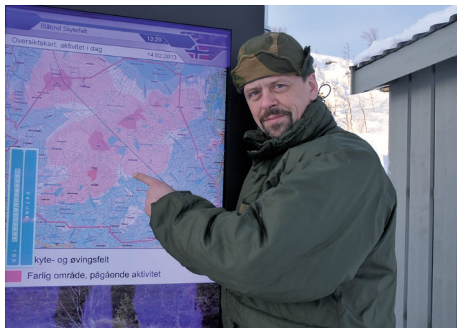
Elektroniske informasjonstavler viser aktivitet som pågår.

Ved feltets hovedinnfartsveier er det satt opp informasjonstavler/skilt med kart og/eller annen viktig informasjon. Utforming, størrelse og mengde informasjon avhenger av veiens bruksomfang.