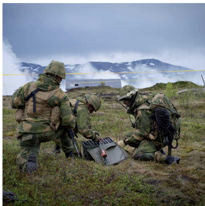
Mange ulike avdelinger trener i feltet.

I tillegg gjelder kommunale bestemmelser. Kontakt kommunen for nærmere informasjon.