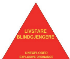
Skilt rundt nedslagsfelt.

Nedslagsfeltet er merket med "Livsfare blindgjengere". Skiltene er satt opp med ca. 50 meters mellomrom rundt hele nedslagsfeltet, med unntak av bratte fjellskråninger som er tilnærmet utilgjengelig. Skiltansiktet er rettet ut av feltet. Skiltene er montert på impregnerte trestolper med røde bånd. Der grensa går igjennom skog er det ryddet gater på ca. 6 meters bredde for at det skal være sikt mellom skiltene. Innenfor nedslagsfeltet er det fare for blindgjengere. Ferdsel i dette området kan derfor medføre livsfare selv om det ikke er skyting i feltet. Ammunisjonsrester og andre gjestander MÅ IKKE RØRES. Ferdsel frarådes.