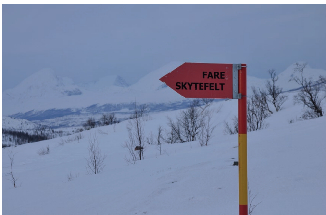
Yttergrensene på feltet er merket.

Skiltene er satt opp med ca. 50 meters mellomrom rundt hele yttergrensen, med unntak av bratte fjellskråninger som er tilnærmet utilgjengelig. Skiltene peker inn i feltet. Skiltene er montert på røde stålrør med gule bånd. Der grensa går igjennom skog er det ryddet gater på ca. 6 meters bredde for at det skal være sikt mellom skiltene. Dersom det er skyting i feltet kan det være forbundet med fare å ferdes innenfor skytefeltgrensen. Innenfor skytefeltet kan forurenset grunn og vann påtreffes.