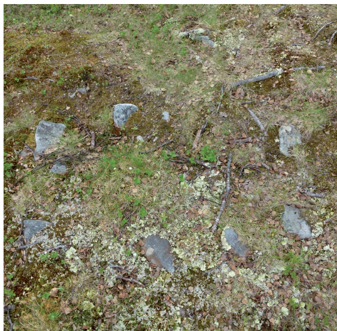
Arran (ildsted). Et typisk samisk kulturminne i Mauken.

Allmennhetens bruk skal heller ikke medføre konflikt med kulturminneinteresser.