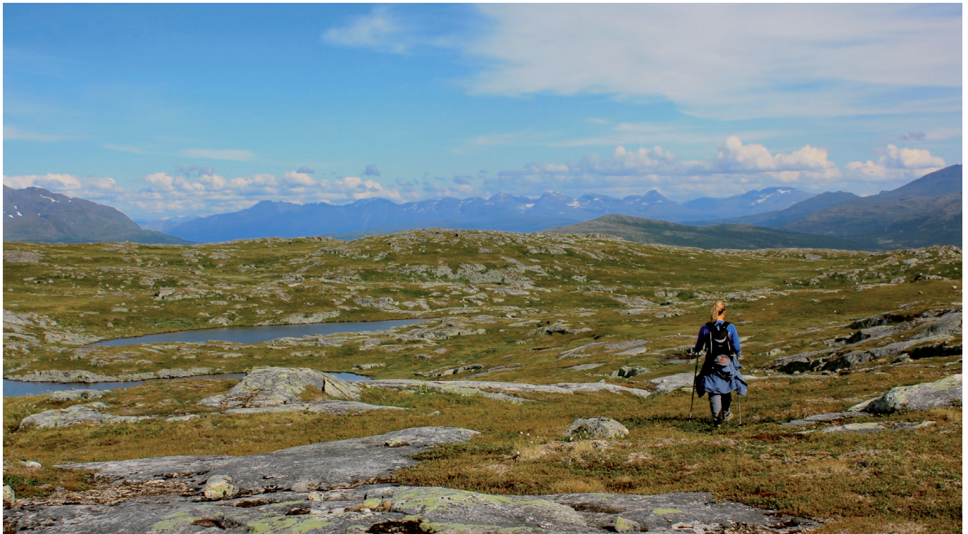
Alle kan dra på tur i feltet.