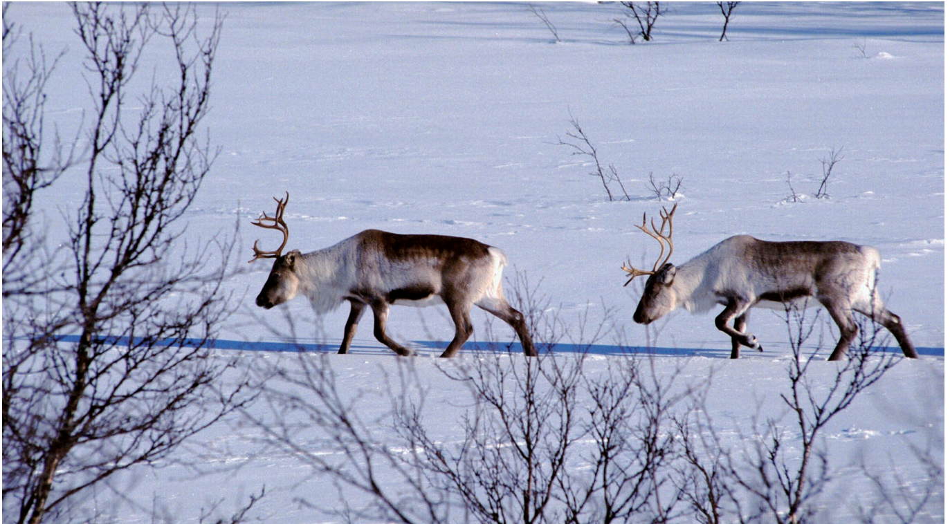
Mauken-Blåtind er både øvingsområde for Forsvaret og vinterbeite for rein.