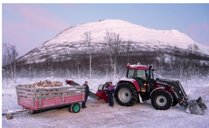
Skogsdrift i Skardalen.

I Blåtind kan det drives beitebruk med sau og ungfø innenfor gjeldende rettigheter. Ved behov foretas tilpassinger mellom Forsvarets øvelser på den ene side og tilsyn med eller sankning av beitedyr på den annen side.