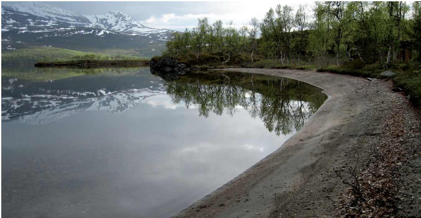
Strandsonen rundt Takvatnet er skjernet for militær aktivitet.