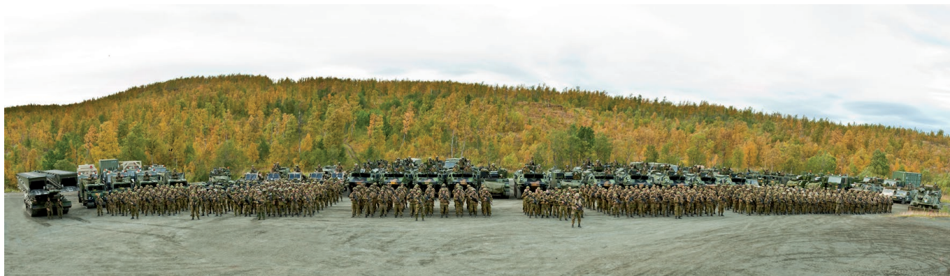
Det kan være mange soldater på en gang i området. Her er 2.Bn oppstilt på Akkaseter.