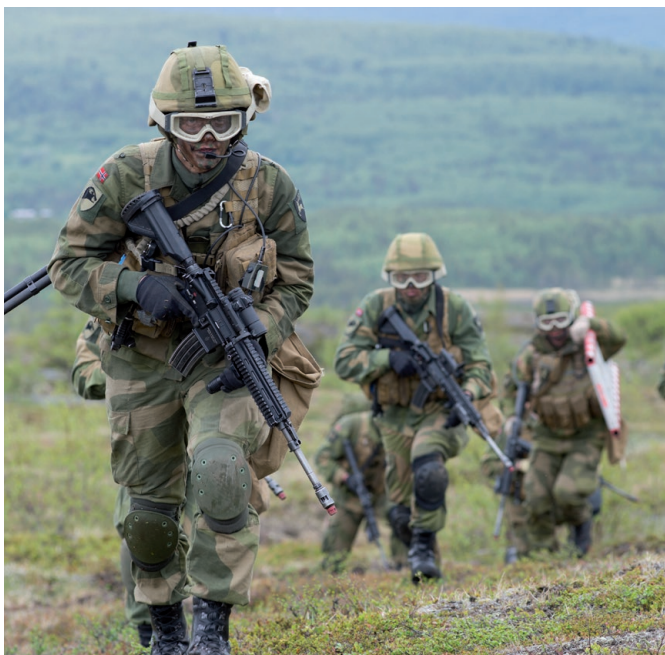
Soldater fra Brigade nord trener i Mauken.

Oppdraget om flerbruksplanlegging for skyte- og øvingsfeltene er gitt i Stortingsmelding nr. 21 (1992-93) "Handlingsplan for miljøvern i Forsvaret". I meldingen understrekes at de faste skyte- og øvingsfeltene skal dekke de primære behov for utdanning og trening og er Forsvarets viktigste "klasserom". Feltene er viktige grunnlagsinvesteringer og en del av Forsvarets infrastruktur.