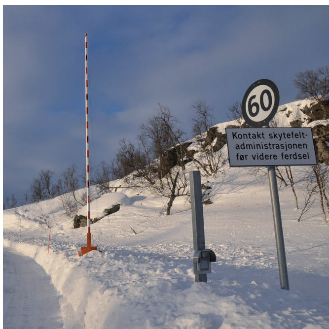
Veiene i feltet er ikke åpne for allmenn motorferdsel.

Forsvaret ønsker at tradisjonelt friluftsliv, herunder sopp- og bærplukking, skal kunne utøves innenfor skyte- og øvingsfeltet, forutsatt at aktivitetene ikke er til ulempe for Forsvarets virksomhet. Utøvelsen må også ta hensyn til biologisk mangfold og kulturminneinteresser.