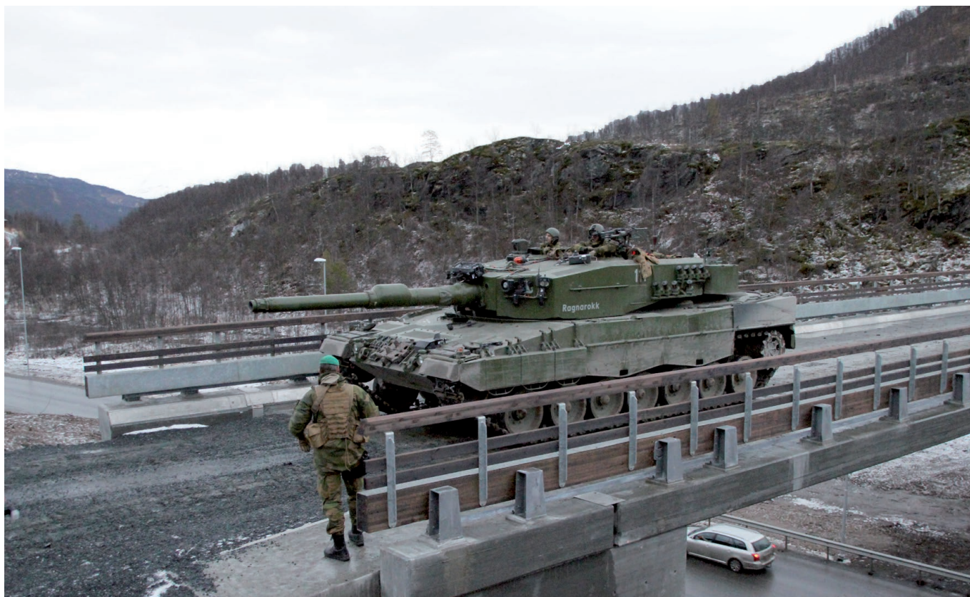
Stridsvogn krysser brua over E6.

Ved begravelser på Vassmo kirkegård skal Forsvaret, på anmodning fra kirkekontoret, innstille all støyende aktivitet i feltet.