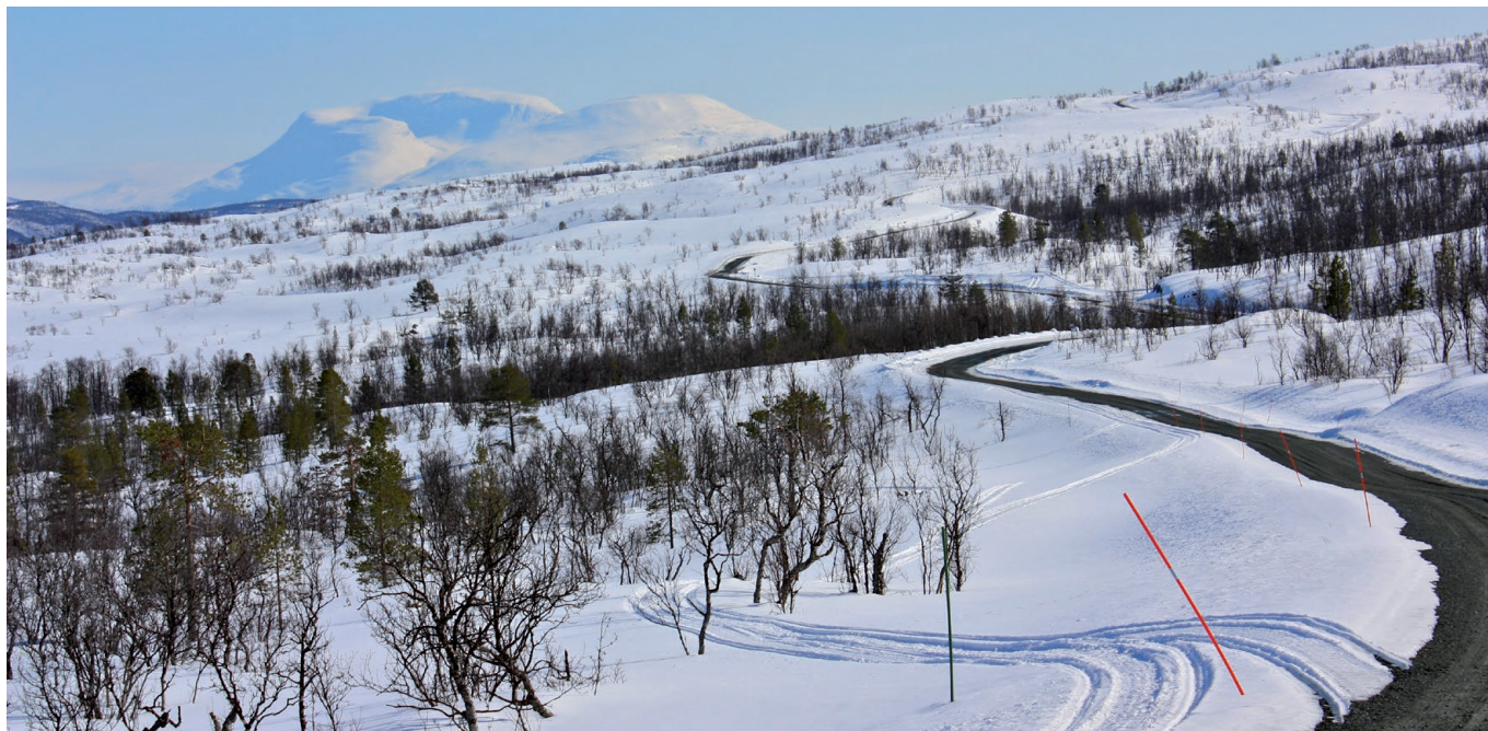
Sammenbindingsveien mellom Mauken og Blåtind er tilpasset terrenget for å redusere inngrepet mest mulig.