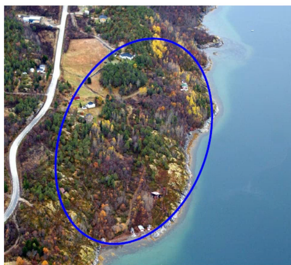
Figur 3 Flyfoto av planområdet

Planen omfatter forslag F4, Hyttefelt på Henriksnes. Under utarbeidelsen av kommuneplanens arealdel har Malangen blitt pekt på som det området i kommunen som er mest etterspurt for fritidsbebyggelse og reiselivsanlegg. Ved å tilrettelegge for fritidsbebyggelse kan kommunen demme opp for en kanskje tilfeldig og uheldig dispensasjonspraksis.